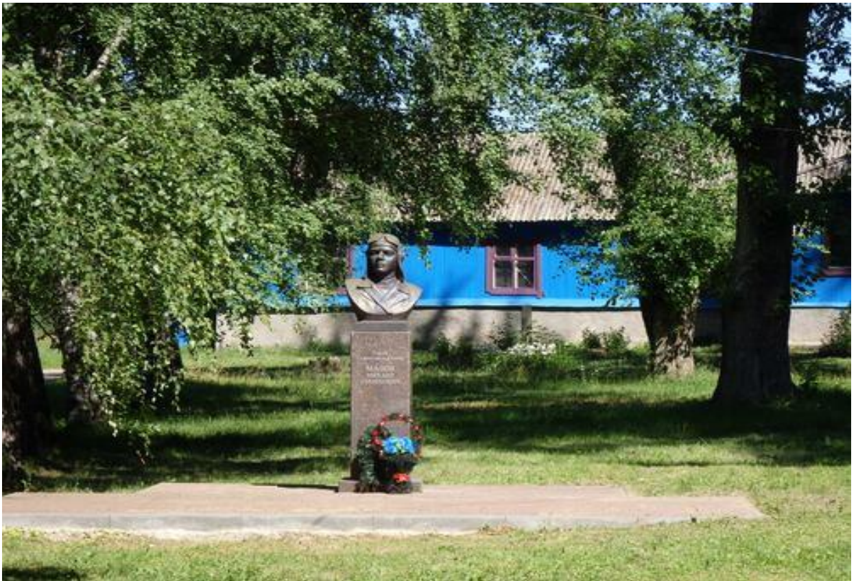
Памятник герою М. С. Малову