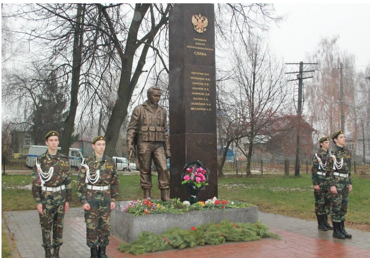
Памятник воинам интернационалистам