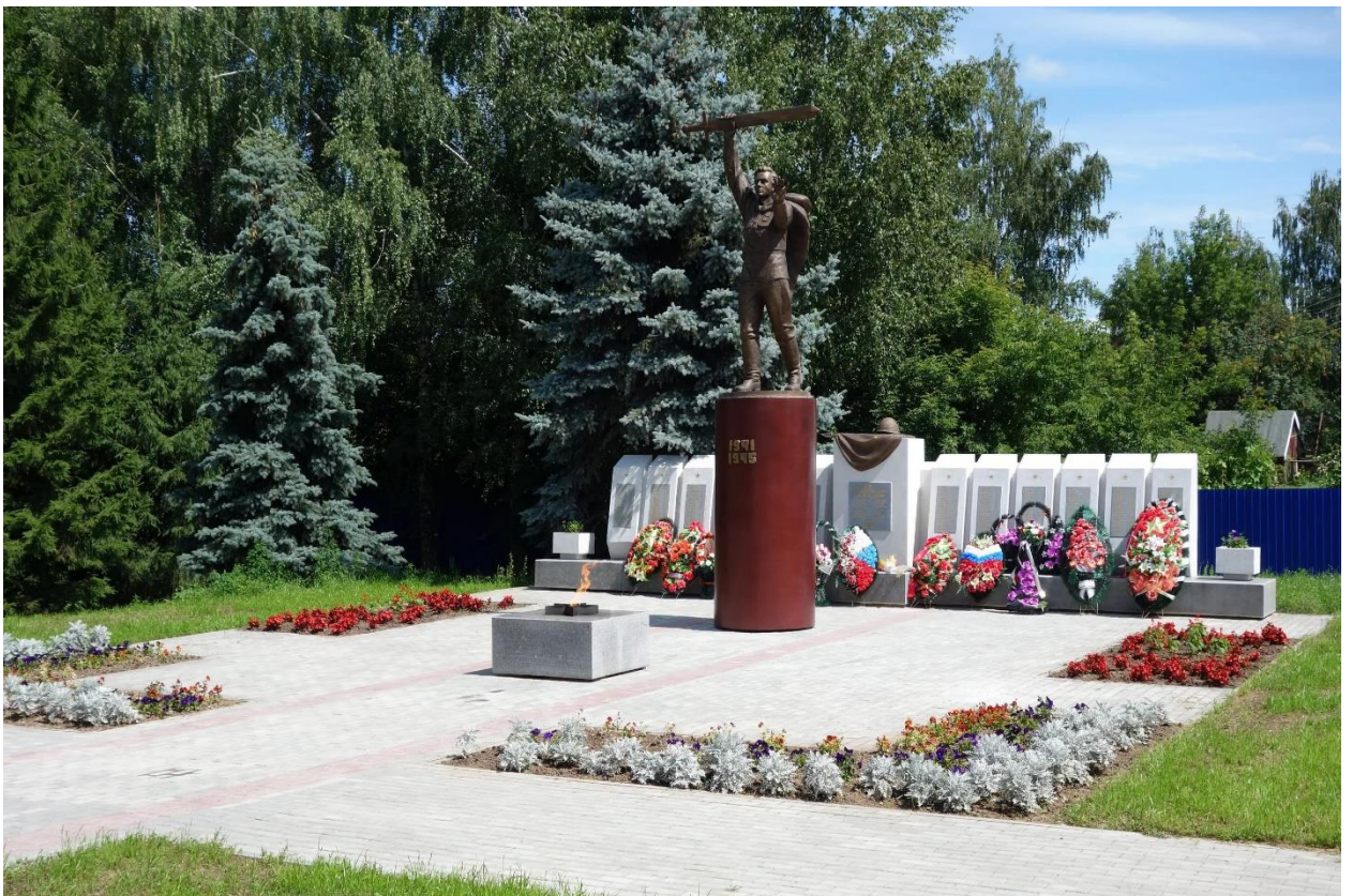
Мемориал Победы и вечный огонь