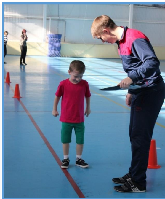
Мой папа - тренер

С/р игра «Семья» (обогащение социально-игрового опыта между детьми; развитие игровых умений по сюжету)