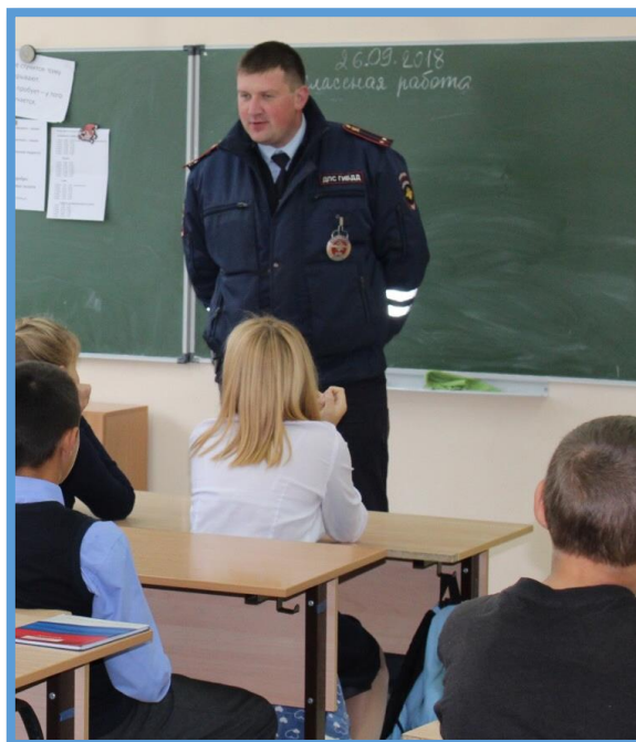
Мой папа – инспектор ДПС