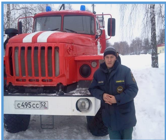
Мой папа – пожарный

Цель: Познакомить детей с разными профессиями их родителей, о важности всех профессий нашего поселка. Создать радостное настроение, учить детей уважительно относиться к труду их родителей.